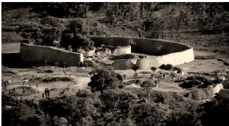
O Estado do zimbabwe

O estado do Zimbabwe não era uma unidade geográfico-administrativa contínua, mas sim uma capital com as características já descritas, apenas com vários centros regionais com igual aspecto.