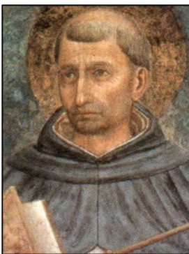
Fig.2 – São Tomás de Aquino

Caro aluno, já teve a ocasião de estudar uma das lições deste filósofo, não é? O que é que estudou dele? Lembra-se? Sim, acho que se lembra. Aprendeu o seu pensamento político. Desta vez vai estudar o pensamento de Aquino no âmbito religioso.