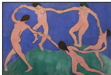
Fig.4 – Coreografia (a dança)

Artes rítmicas (ou de movimento) – São artes que, na sua essência, produzem obras que exprimem a beleza mediante várias firmas: sons, ritmos e movimentos. Estas, por sua vez subdividem-se em: