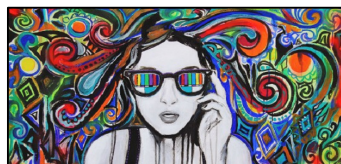
Fig.3 - Pintura

Artes plásticas – São artes que exprimem a beleza sensível através do uso das formas e das cores. São as seguintes: