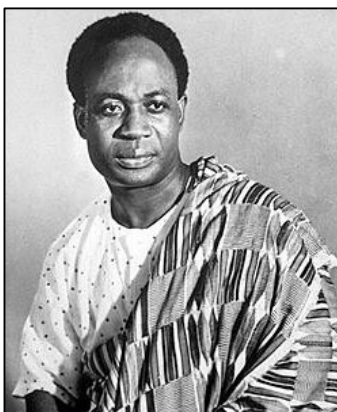
Fig.4- Kwame Nkrumah

Silvestre williamn encontra-se com Antenor Firmont. Em vez de discutir o problema da África, vão discutir os problemas da raça. Era o primeiro congresso pan-africano.