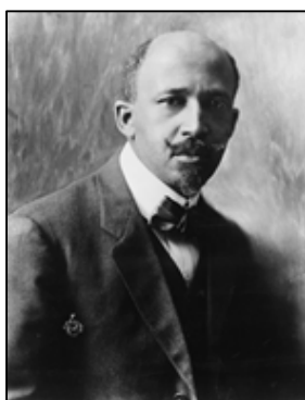
Fig.3- Du Bois

O renascimento negro teve como intenção dar a possibilidade aos negros de lutar arduamente pela sua causa, pôr em causa a alienação do negro.