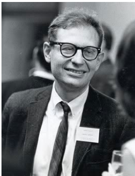
Fig.3 - Laurence Kohlberg

Kohlberg divide o desenvolvimento da consciência moral em três níveis.